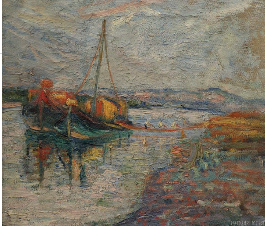
Дереглије на Сави

Историчари уметности рад Надежде Петровић обично деле на четири периода: минхенски, српски, париски и ратни. У Паризу је живела у атељеу Ивана Мештровића, похађала је неформалну модерну школу Марије Васиљев, вредно је радила, обилазила изложбе, често посећивала Лувр и гробље Пер ла Шез, одлазила у позориште да гледа Сару Бернар, дружила се са руским и српским уметницима. Био је то и период упознавања са авангардним уметничким токовима, са уметницима попут Матиса и Пикаса. Под утиском виђеног, сликала је Булоњску шуму, језеро у Булоњској шуми, кеј на Сени, мост на Сени... А сматра се да потпуну уметничку зрелост постиже плаво-зеленом композицијом „Нотр Дама“.